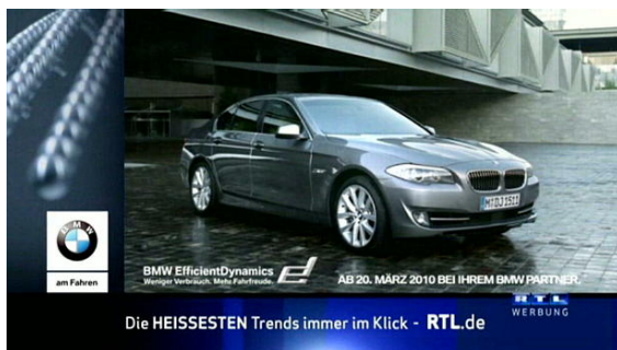
TV - Exclusive Position - individueller Pre-Split

Im individuellen Pre-Split bei RTL wurde das Key Visual mit den schwingenden Metallkugeln aus dem Spot auch im Rahmen des Splitscreens integriert. Beim Logomorphing bei VOX wurde an die Stelle der strahlendroten VOX Kugel die Metallkugel als Key Visual platziert: So gelang die perfekte Symbiose zwischen BMW-Branding und starker Sendermarke. Beim Newscountdown war das BMW-Branding Teil des Rahmens und sorgte hier für zusätzliche Markenpräsenz. Im Movesplit wurde das n-tv Senderlogo zunächst von den schwebenden Metallkugeln überlagert und "moved" dann in einem fließenden Bildwechsel in den klassischen Spot über.