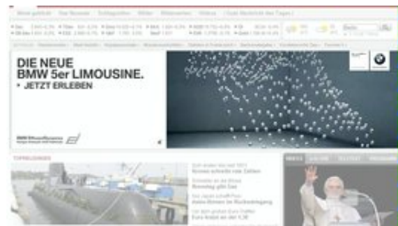
Online In-Page Werbeform - XXL-Banner 2