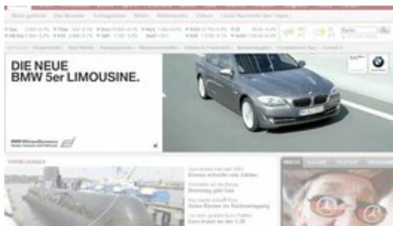
Online In-Page Werbeform - XXL-Banner 1

Auf n-tv.de komplettierten Sonderinszenierungen die Kampagne. Ein expandable XXL-Banner ließ die Metallkugeln über den redaktionellen Content fallen und daraus entstand die Kugel-Silhouette des neuen 5er BMW.