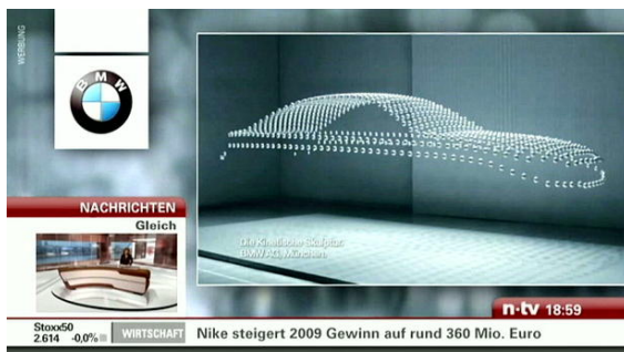
TV - Exclusive Position - Newscountdown