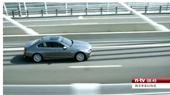
TV - Special Creation - individueller Movesplit