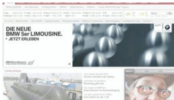
Online In-Page Werbeform - XXL-Banner 3